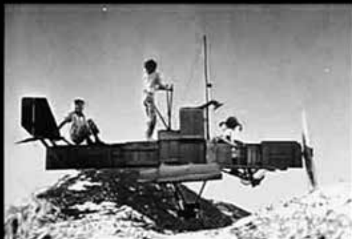
Pippi Langkous vliegtuig